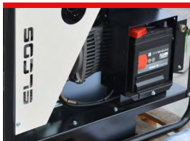
BATTERY - BATTERIA* *Only AE models - Solo modelli AE