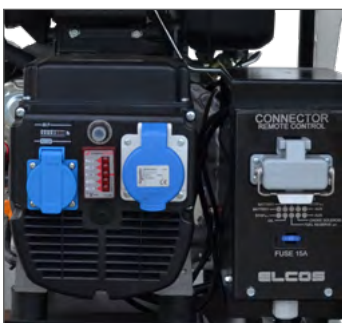
Type - Tipo 1

1 Socket - Presa Schuko 16A 230V 1 Socket - Presa CEE 16A 2P + T 230V Voltmeter - Voltmetro Circuit breaker - Disgiuntore Hour counter - Contatore