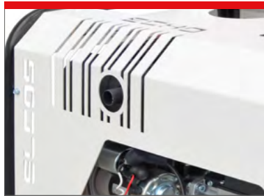
HEAT GUARDS PROTEZIONE PARTI CALDE