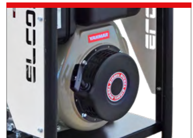
SNATCH START UP AVVIAMENTO AUTOAVVOLGENTE

Auto choke system - Starter automatico High Performance - Elevate prestazioni