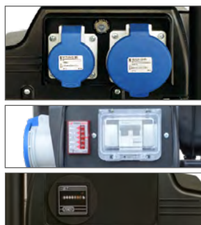
Type - Tipo 2

1 Socket - Presa Schuko 16A 230V 1 Socket - Presa CEE 16A 2P + T 230V Voltmeter - Voltmetro Circuit breaker - Disgiuntore Hour counter - Contatore