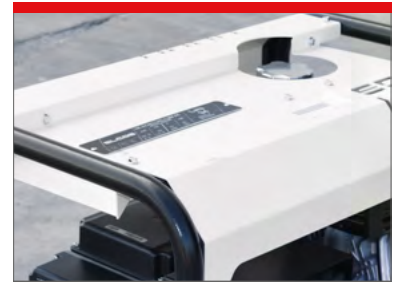
TANK PROTECTED AGAINST IMPACTS PROTEZIONE ANTIURTO SERBATOIO