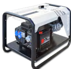
GE ECHO 048 H