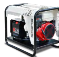
GE iECHO 048 H