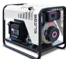
GE ECHO 065 Y