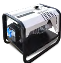
GE ECHO 035 H

* Not to be taken simultaneously with the three-phase power - Non prelevabile contemporaneamente alla potenza trifase