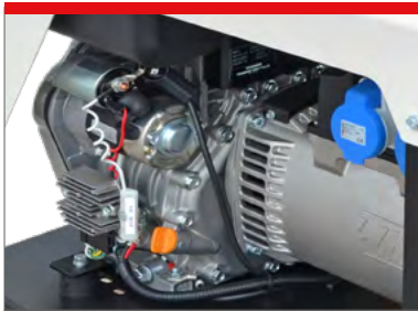
LOW OIL SHUTDOWN SYSTEM SPEGNIMENTO PER MANCANZA OLIO