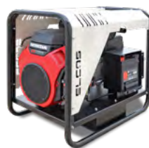
GE ECHO 110 H