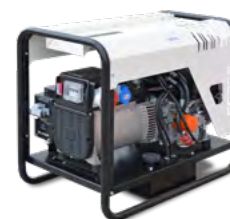
GE ECHO 130 K