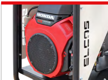
TUBE-SHAPED FRAME TELAIO TUBOLARE